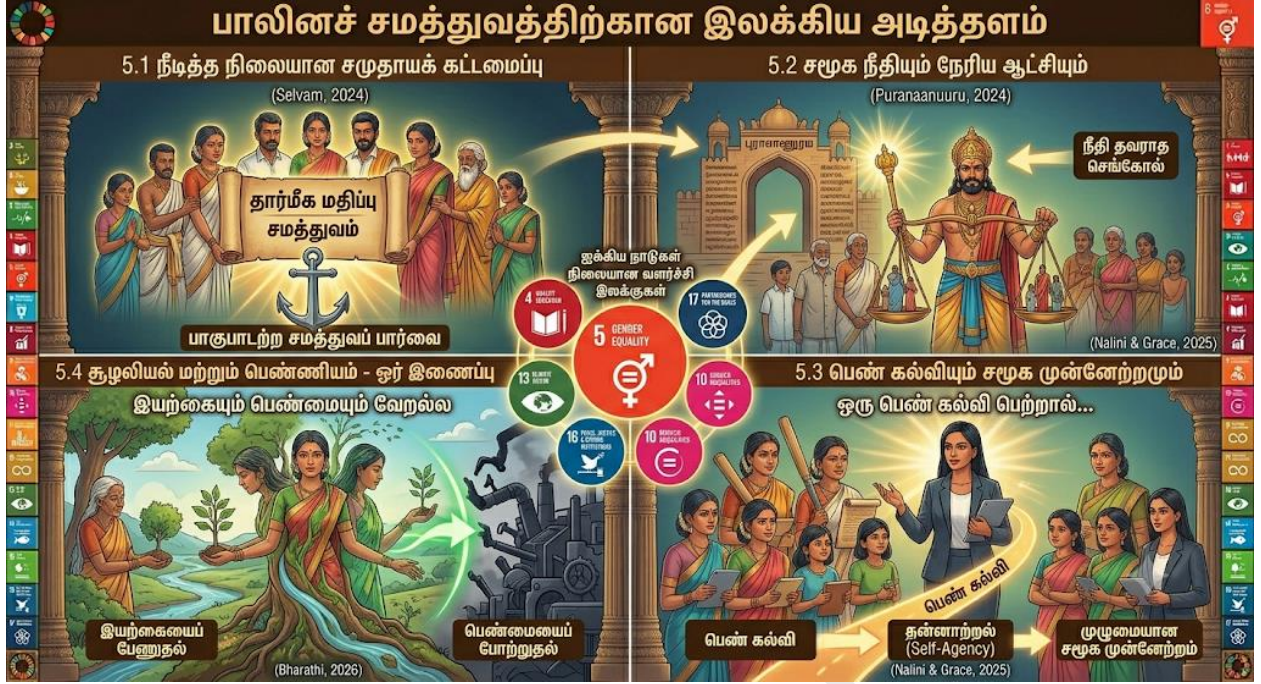
Fig5: பாலினச் சமத்துவம் மற்றும் நிலையான சமூக வளர்ச்சி: ஓர் இலக்கியப் பார்வை.

இந்த ஓவியம் தமிழ் இலக்கியங்கள் முன்வைக்கும் பாலினச் சமத்துவத்தை ஐக்கிய நாடுகள் சபையின் நிலையான வளர்ச்சி இலக்குகளுடன் (UN SDGs) ஒப்பிடுகிறது. நேரிய ஆட்சிமுறை, பெண் கல்வி, மற்றும் இயற்கையைப் பேணுதல் ஆகியவற்றை உள்ளடக்கிய தமிழரின் வாழ்வியல் விழுமியங்கள், எவ்வாறு ஒரு நீடித்த சமூகக் கட்டமைப்பிற்கு வலுவான அடித்தளமாக அமைகின்றன என்பதை இது விளக்குகிறது. பெண் தன்னாற்றல் பெறுவதே உண்மையான சமூக முன்னேற்றம் என்பதை இப்படம் உறுதிப்படுத்துகிறது.