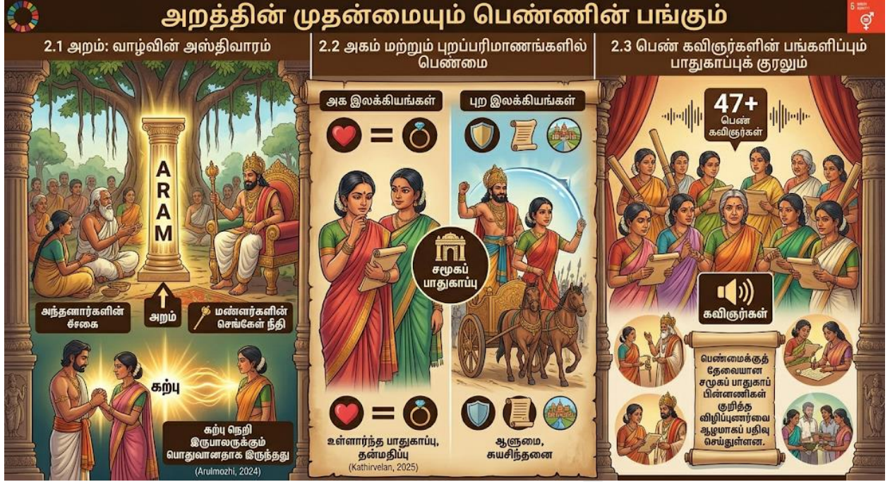
Fig2: அறத்தின் அடிப்படையில் தமிழ்ப் பெண்மையின் மாட்சிமை.

இந்த ஓவியம் பண்டைத் தமிழ்ச் சமூகத்தில் 'அறம்' என்னும் கோட்பாடு எவ்வாறு வாழ்வியலின் அடித்தளமாக இருந்தது என்பதை விளக்குகிறது. கணவன்-மனைவி இருவருக்கும் பொதுவான கற்பு நெறி, அகம்-புற இலக்கியங்களில் பெண்களின் ஆளுமை மற்றும் 47-க்கும் மேற்பட்ட பெண் கவிஞர்களின் இலக்கியப் பங்களிப்பு ஆகியவற்றை இது காட்டுகிறது. சமூகப் பாதுகாப்பில் பெண்களின் முக்கியத்துவத்தையும், அறநெறி சார்ந்த அவர்களது வாழ்வியல் மேன்மையையும் இந்தப்படம் அழகாகப் படம்பிடித்துக் காட்டுகிறது.