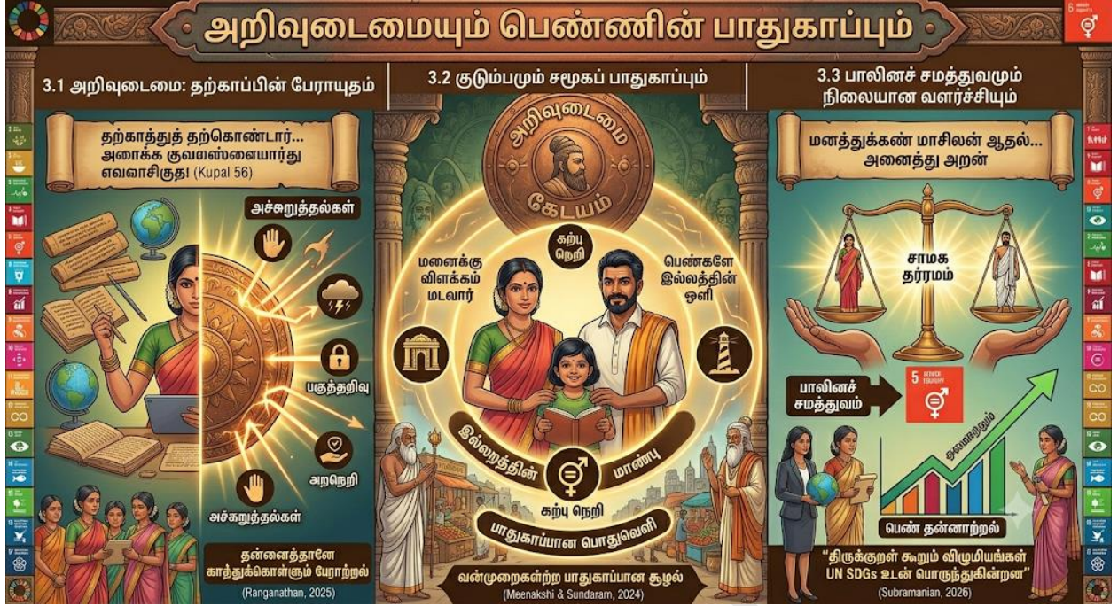
Fig3: அறிவுடைமையும் பெண்ணின் தற்காப்பு அரணும்.

இந்த ஓவியம் திருக்குறளின் அறிவுடைமை என்பது பெண்களின் தற்காப்பிற்கான பேராயுதம் என்பதை விளக்குகிறது. இல்லறத்தின் மேன்மையும், ஆண்-பெண் சமத்துவமும் சமூகப் பாதுகாப்பிற்கு எவ்வாறு அடித்தளமாக அமைகின்றன என்பதையும் இது காட்டுகிறது. மேலும், வள்ளுவம் வலியுறுத்தும் அறநெறிகள் ஐக்கிய நாடுகள் சபையின் பாலினச் சமத்துவ இலக்குகளுடன் (SDG 5) எவ்வாறு இணக்கமாகச் செயல்படுகின்றன என்பதைப் படம்பிடித்துக் காட்டுகிறது.