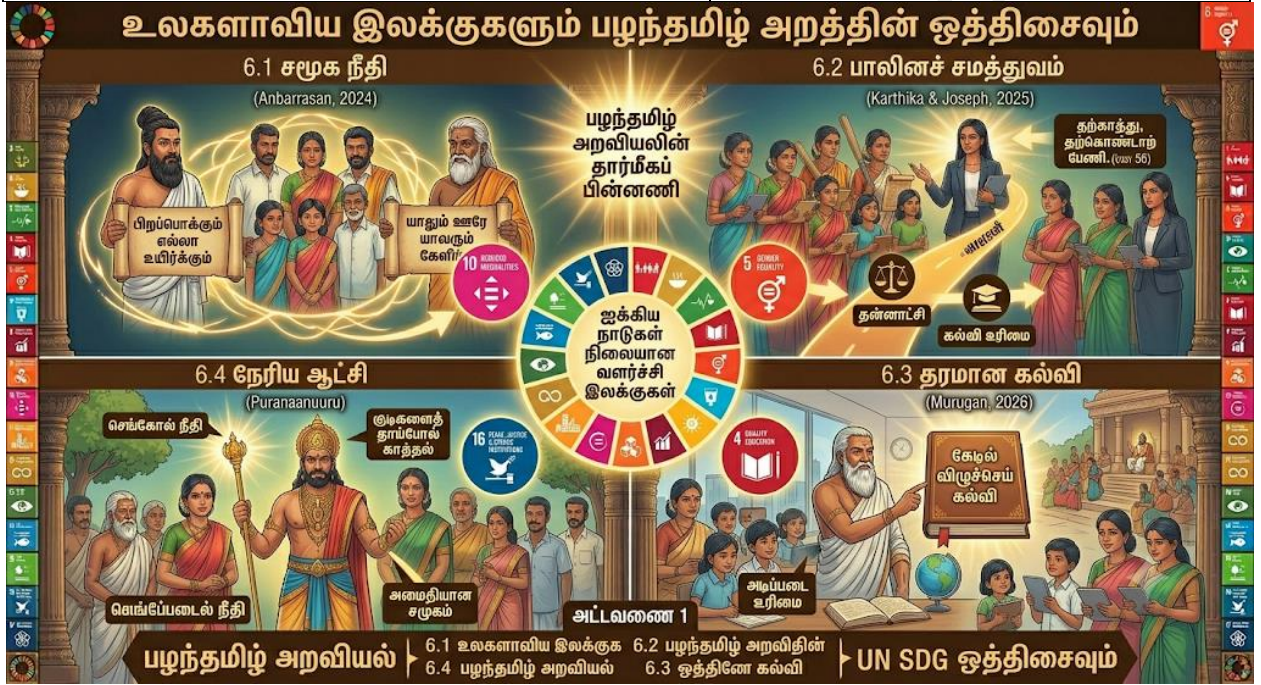
Fig6: உலகளாவிய இலக்குகளும் பழந்தமிழ் அறவியலின் ஒத்திசைவும்.

இந்த ஓவியம் ஐக்கிய நாடுகள் சபையின் நிலையான வளர்ச்சி இலக்குகளுக்கும் (UN SDGs) பழந்தமிழ் இலக்கிய அறவியலுக்கும் இடையிலான ஆழமான ஒற்றுமைகளை விளக்குகிறது. சமூக நீதி, பாலினச் சமத்துவம், தரமான கல்வி மற்றும் நேரிய ஆட்சிமுறை ஆகிய நவீன உலக இலக்குகள், ஆயிரக்கணக்கான ஆண்டுகளுக்கு முன்பே தமிழ் அறநூல்களில் வலியுறுத்தப்பட்டதை இப்படம் காட்சிப்படுத்துகிறது. இத்தகைய வரலாற்று விழுமியங்கள் இன்றும் மனித மேம்பாட்டிற்கு எவ்வாறு வழிகாட்டுகின்றன என்பதை இது மிக அழகாகச் சித்தரிக்கிறது.