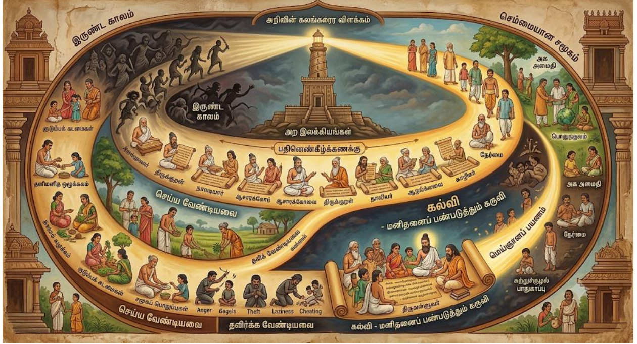
Fig2: அற இலக்கியங்கள்: வாழ்வின் கலங்கரை விளக்கம்

இந்தப் படம் அற இலக்கியங்கள் மனித வாழ்வைச் செம்மைப்படுத்தும் கலங்கரை விளக்கமாகத் திகழ்வதை விளக்குகிறது. அறியாமை மற்றும் தீய பண்புகள் நிறைந்த இருண்ட காலத்திலிருந்து, ஒழுக்கம், கல்வி மற்றும் அறநெறிகள் மூலம் மனிதனை ஒரு செம்மையான சமூகத்தை நோக்கி இப்படம் இட்டுச் செல்கிறது. வாழ்வின் கடமைகளை உணர்த்தி, மெய்ஞ்ஞானப் பாதையில் மனிதனைப் பண்படுத்துவதே அற இலக்கியங்களின் நோக்கம் என்பதை இது தெளிவாகக் காட்சிப்படுத்துகிறது.