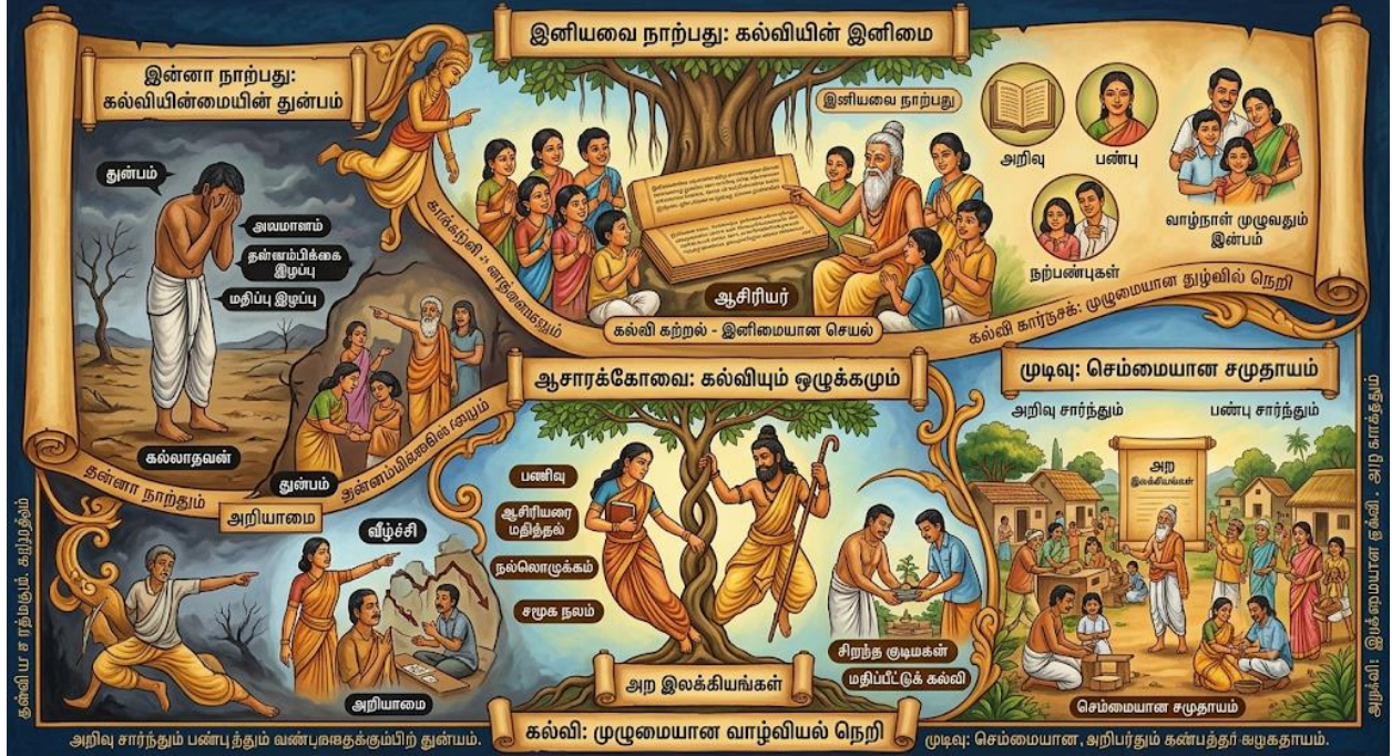
Fig5: அற இலக்கியங்கள்: கல்வி மற்றும் வாழ்வியல் நெறிகள்

இந்தப் படம் கல்வி குறித்த அற இலக்கியங்களின் மூன்று பரிமாணங்களை விளக்குகிறது. இனியவை நாற்பது கல்வியின் இன்பத்தையும், இன்னா நாற்பது கல்வியின்மையின் துன்பத்தையும், ஆசாரக்கோவை கல்விக்கும் ஒழுக்கத்திற்குமான பிணைப்பையும் உணர்த்துகின்றன. அறிவும் பண்பும் இணைந்த கல்வியே ஒருவனைச் செம்மையான குடிமகனாக மாற்றி, சமூக மேம்பாட்டிற்கு வழிவகுக்கும் என்பதை இப்படம் மிகத்தெளிவாகச் சித்தரிக்கிறது.