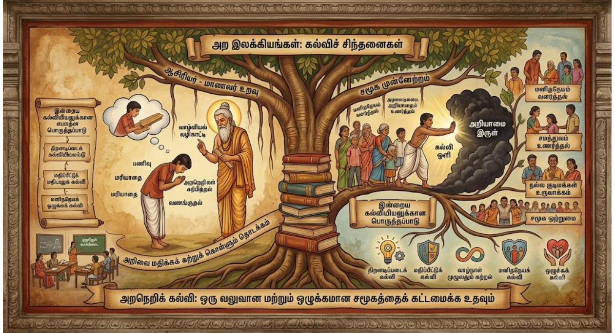
Fig6: அறநெறிக் கல்வி: ஆசிரியர், மாணவர் மற்றும் சமூக மாற்றம்

இந்தப் படம் அற இலக்கியங்கள் வலியுறுத்தும் ஆசிரியர்-மாணவர் உறவு மற்றும் சமூக முன்னேற்றத்தை அழகாகக் காட்டுகிறது. ஆசிரியர் மாணவனைச் செம்மைப்படுத்தும் வழிகாட்டியாகச் செயல்பட, மாணவன் பணிவுடன் அறிவைக் கற்கிறான். அறிவாமை இருளை நீக்கி, மனிதநேயம் மற்றும் சமத்துவத்தை வளர்ப்பதே கல்வியின் நோக்கம். நவீனக் கல்வி முறையோடு இச்சிந்தனைகள் ஒன்றிணைந்து, வலுவான சமூகத்தைக் கட்டமைக்கத் துணைபுரிவதை இப்படம் விளக்கமாகக் காட்சிப்படுத்துகிறது.