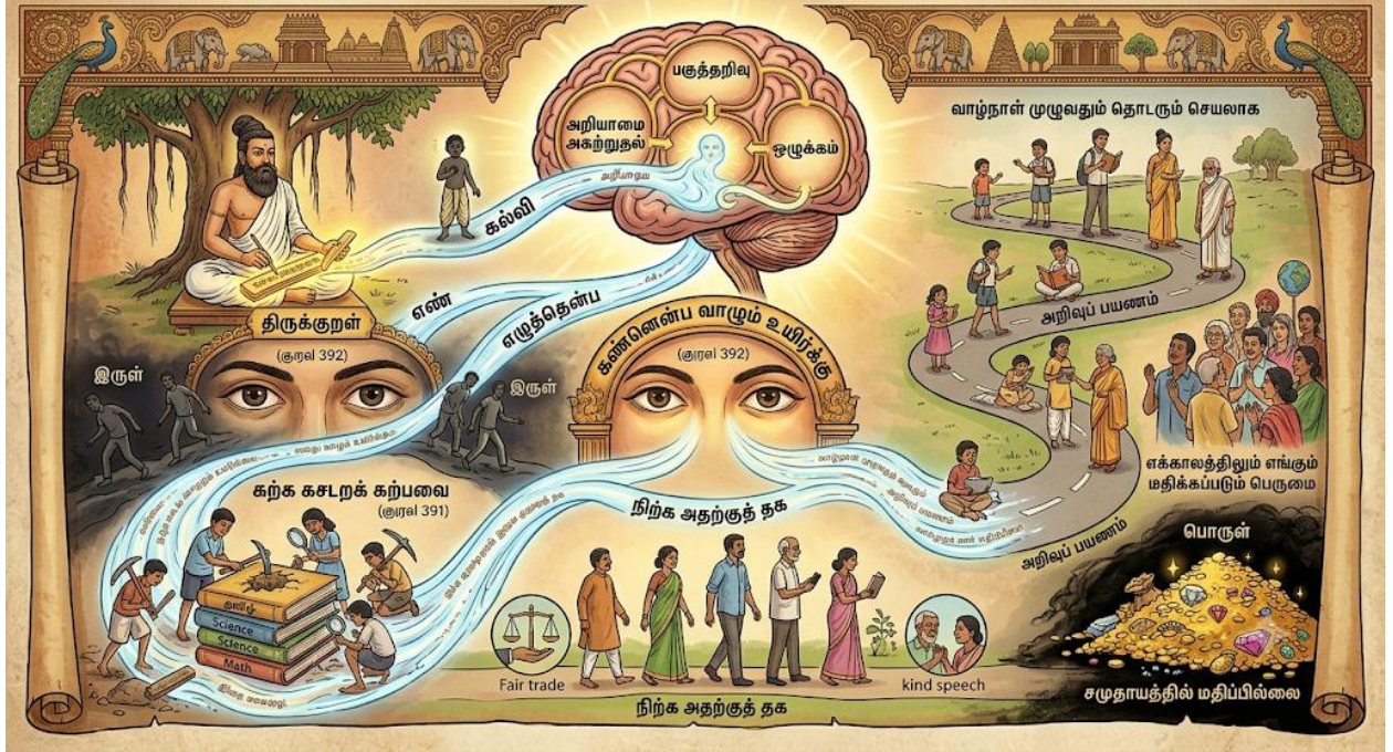
Fig3: திருக்குறள்: வாழ்வின் கலங்கரை விளக்குக் கல்வி

இந்தப் படம் திருக்குறள் போதிக்கும் கல்வியின் சிறப்பை அழகாக விளக்குகிறது. எண் மற்றும் எழுத்து என்னும் இரு கண்களைப் போலக் கல்வி மனித வாழ்விற்கு இன்றியமையாதது என்பதை இது காட்டுகிறது. பிழையற்ற கற்றலும், கற்ற நெறிப்படி நின்றலும் ஒருவனைப் பகுத்தறிவுள்ளவனாகவும், ஒழுக்கமானவனாகவும் மாற்றுகிறது. வாழ்நாள் முழுவதும் தொடரும் அறிவார்ந்த பயணமே உண்மையான கல்வி என்பதை இப்படம் உணர்த்துகிறது.