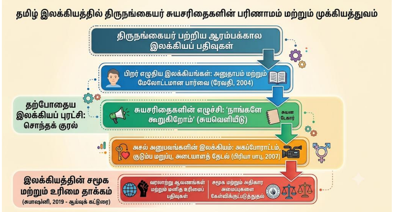
Fig1: தமிழ் இலக்கியத்தில் திருநங்கையர் சுயசரிதைகளின் பரிணாம வளர்ச்சி

இவ்வரைபடம், தமிழ் இலக்கியத்தில் திருநங்கையர் பற்றிய பதிவுகள் எவ்வாறு பரிணாம வளர்ச்சி அடைந்துள்ளன என்பதை விளக்குகிறது. தொடக்கத்தில் பிற எழுத்தாளர்களின் மேலோட்டமான பார்வையில் (ரேவதி, 2004) இருந்த நிலை மாறி, தற்போது தங்களின் சொந்தக் குரலில் அசல் வாழ்வனுபவங்களைச் சுயசரிதைகளாக (பிரியா பாபு, 2007) எழுதும் புரட்சியாக மாறியுள்ளது. இறுதியில், இவர்களின் எழுத்துக்கள் வெறும் இலக்கியமாக மட்டுமில்லாமல், சமூக மாற்றத்தை ஏற்படுத்தும் வரலாற்று மற்றும் மனித உரிமை ஆவணங்களாக (சுபாஷினி, 2019) உருவெடுத்துள்ளதை இக்காட்சிப்படம் தெளிவாகக் காட்டுகிறது.