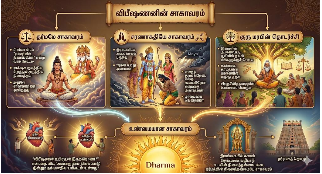
படம் 4: விபீஷணனின் சாகாவரத்தின் தத்துவ அடித்தளங்கள்

மேலுள்ள வரைபடம் விபீஷணனின் சாகாவரத்தின் மூன்று தத்துவ அடித்தளங்களை விளக்குகிறது. முதலாவதாக, "தர்மமே சாகாவரம்" – பிரம்மாவிடம் "தர்மத்தில் நிலைப்பேன்" என்ற வரத்தைக் கேட்டதும், ராக்கஷ குலத்தில் பிறந்தும் அறத்தில் நிலைத்ததுமே அவனுக்குச் சாகாவரத்தை அளித்தது. இரண்டாவதாக, "சரணாகதியே சாகாவரம்" – இராமனிடம் அடைக்கலம் புகுந்து, "நான் உமது அடியவன்" என்று சரணாகதி அடைந்ததன் மூலம், எதைத் துறக்கிறேன், எதை அடைகிறேன் என்பதை முழுமையாக அறிந்தவனாக விளங்கினான். மூன்றாவதாக, "குரு மரபின் தொடர்ச்சி" – இராமரின் ஆணைப்படி பூமியில் தங்கி மக்களுக்குச் சேவை செய்து, அவர்களை உண்மை மற்றும் தர்மத்தின் பாதையில் வழிநடத்தும் பணியை ஏற்றான். இம்மூன்று அடித்தளங்களும் இணைந்து, உடலின் நிலைத்தன்மையல்ல, தர்மத்தின் நிலைத்தன்மையே உண்மையான சாகாவரம் என்னும் தத்துவத்தை நிறுவுகின்றன. "விபீஷணன் உயிருடன் இருக்கிறானா" என்பதை விட, "அவனது தர்ம நிலைப்பாடு இன்றும் நம் மனதில் உயிருடன் உள்ளது" என்பதே உண்மையான சாகாவரமாகும்.