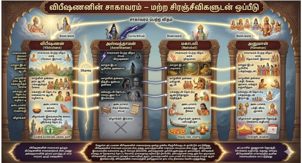
படம் 3: விபீஷணனின் சாகாவரம் - மற்ற சிரஞ்சீவிகளுடன் ஒப்பீடு

விபீஷணனின் சாகாவரம் மற்ற சிரஞ்சீவிகளிடமிருந்து பல வழிகளில் வேறுபட்டது. அஸ்வத்தாமன் சாபத்தின் காரணமாக நித்திய துன்பத்துடன் அலையும் நிலையில், விபீஷணன் தர்மத்தின் வெகுமதியாகச் சாகாவரத்தைப் பெற்றான். அனுமான் பக்தியின் உருவகமாக விளங்கினால், விபீஷணன் தர்மத்தின் உருவகமாக விளங்குகிறான். மேலும், அவன் இலங்கையின் மன்னனாக முடிசூட்டப்பட்டு, நீதியுடன் ஆட்சி செய்தான்.