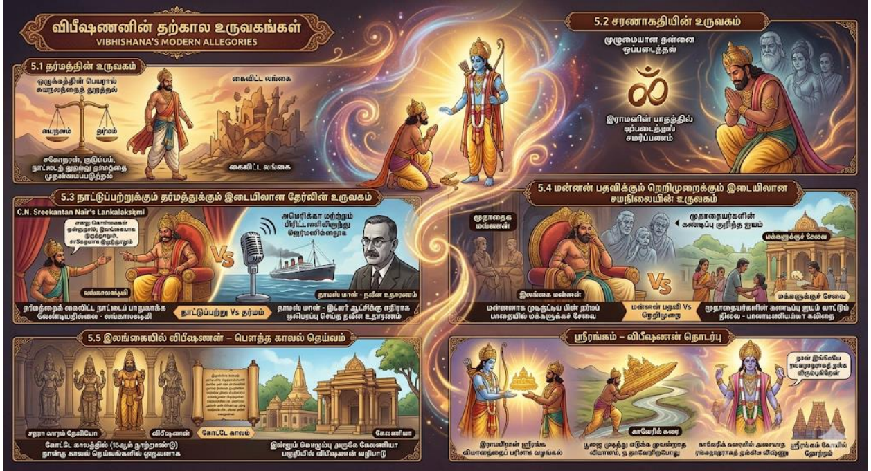
படம் 5: விபீஷணன் – தற்காலச் சமூகத்தில் ஐந்து உருவகங்கள்

அவனுக்குக் காட்சி தந்து, "நான் இங்கேயே ரங்கநாதராகத் தங்க விரும்புகிறேன்" என்று கூறினார். இதுவே ஸ்ரீரங்கம் கோயிலின் தோற்றத்திற்குக் காரணமாக அமைந்தது.