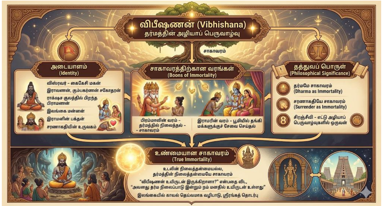
படம் 1: விபீஷணன் – அடையாளமும் சாகாவரமும்

இந்த ஆய்வின் நோக்கம், விபீஷணனின் சாகாவரத்தை வெறும் புராண நிகழ்வாக மட்டும் கருதாமல், அதன் தத்துவ அடித்தளங்களை ஆழ்ந்து நோக்குவதாகும். இதன் மூலம், இந்து மெய்யியலில் தர்மம், சரணாகதி, பக்தி, சாகாவரம் ஆகிய கருத்துகளின் இடைவெளிகளை விளக்கவும், தற்காலச் சமூகத்தில் இக்கதை எவ்விதப் பொருண்மையைக் கொண்டுள்ளது என்பதை ஆராயவும் இக்கட்டுரை முயல்கிறது.