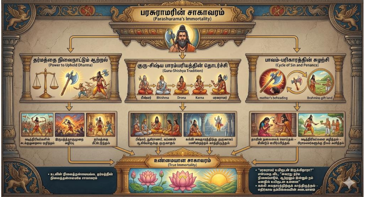
படம் 5: பரசுராமரின் சாகாவரத்தின் தத்துவ அடித்தளங்கள்

இந்த வரைபடம் பரசுராமரின் சாகாவரத்தின் மூன்று தத்துவ அடித்தளங்களை விளக்குகிறது. முதலாவதாக, "தர்மத்தை நிலைநாட்டும் ஆற்றல்" - சுஷத்திரியர்களின் அடக்குமுறையை இருபத்தொருமுறை அழித்து, தர்மத்தை மீட்டெடுத்ததன் மூலம் இப்பண்பு வெளிப்படுகிறது. இரண்டாவதாக, "குரு-சிஷ்ய பாரம்பரியத்தின் தொடர்ச்சி" - பீஷ்மர், துரோணர், கர்ணன் ஆகியோருக்குக் குருவாக இருந்ததும், எதிர்காலத்தில் கல்கி அவதாரத்திற்குக் குருவாகப் பணியாற்றக் காத்திருப்பதும் இதை வெளிப்படுத்துகின்றன. மூன்றாவதாக, "பாவம்-பரிகாரத்தின் சுழற்சி" - தாயின் தலையைக் கொய்து, பின்னர் உயிர்ப்பித்ததும், சுஷத்திரியர்களை அழித்து, பின்னர் பிராமணர்களுக்கு நிலம் அளித்ததும் இதை எடுத்துக்காட்டுகின்றன. இம்மூன்று அடித்தளங்களும் இணைந்து, உடலின் நிலைத்தன்மையல்ல, தர்மத்தின் நிலைத்தன்மையே உண்மையான சாகாவரம் என்னும் தத்துவத்தை நிறுவுகின்றன. "பரசுராமர் உயிருடன் இருக்கிறாரா" என்பதை விட, "அவரது தர்ம நிலைப்பாடும், ஆற்றலும் இன்றும் நம் மனதில் உயிருடன் உள்ளன" என்பதே உண்மையான சாகாவரமாகும். கல்கி அவதாரத்திற்காகக் காத்திருத்தல், எதிர்கால நம்பிக்கையின் அடையாளமாகவும் விளங்குகிறது.