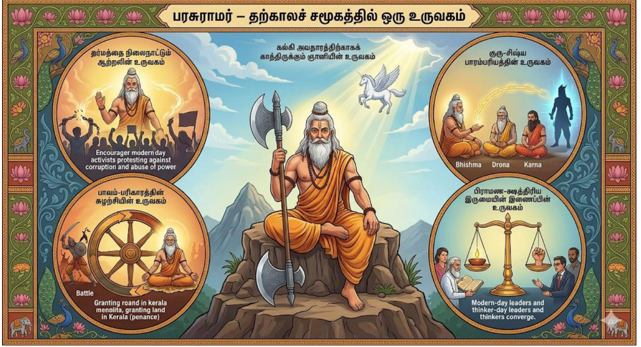
படம் 8: பரசுராமர் – தற்காலச் சமூகத்தில் ஐந்து உருவகங்கள்

இந்த வரைபடம் பரசுராமரின் ஐந்து தற்கால உருவகங்களை விளக்குகிறது. முதலாவதாக, தர்மத்தை நிலைநாட்டும் ஆற்றலின் உருவகம் – சுஷத்திரியர்களின் அதிகாரத் துஷ்பிரயோகத்தை ஒழித்து, இன்று அதிகாரத்தின் தவறான பயன்பாட்டிற்கு எதிரான முன்னுதாரணமாக விளங்குகிறார் . இரண்டாவதாக, குரு-சிஷ்ய பாரம்பரியத்தின் உருவகம் – பீஷ்மர், துரோணர், கர்ணன், கல்கி ஆகியோருக்குக் குருவாக இருந்து, யுகங்களைத் தாண்டிய அறிவின் தொடர்ச்சியின் அடையாளமாக விளங்குகிறார் . மூன்றாவதாக, பிராமண-சுஷத்திரிய இருமையின் இணைப்பின் உருவகம் – பிராமணரின் அறிவையும், சுஷத்திரியரின் வீரத்தையும் ஒருங்கே கொண்டு, அறிவு மற்றும் செயல்திறனின் ஒருங்கிணைப்பின் அவசியத்தை உணர்த்துகிறார் . நான்காவதாக, பாவம்-பரிகாரத்தின் சுழற்சியின் உருவகம் – தாயின் தலையைக் கொய்து மீண்டும் உயிர்ப்பித்ததும், சுஷத்திரியர்களை அழித்துப் பிராமணர்களுக்கு நிலம் அளித்ததும், செயலுக்கு விளைவும், பாவத்திற்குப் பரிகாரமும் இன்றியமையாதது என்பதைக் காட்டுகிறது . ஐந்தாவதாக, கல்கி அவதாரத்திற்காகக் காத்திருக்கும் ஞானியின் உருவகம் – எதிர்காலத்தில் மீண்டும் தர்மம் நிலைநாட்டப்படும் என்னும் நம்பிக்கையின் அடையாளமாக விளங்குகிறார். இவ்வைந்து உருவகங்களும் இணைந்து, தர்மத்தைக் காக்கும் ஆற்றல், அறிவு-செயலின் ஒருங்கிணைப்பு, பாவ-பரிகாரச் சுழற்சி, எதிர்கால நம்பிக்கை ஆகிய மையச் செய்திகளை வெளிப்படுத்துகின்றன.