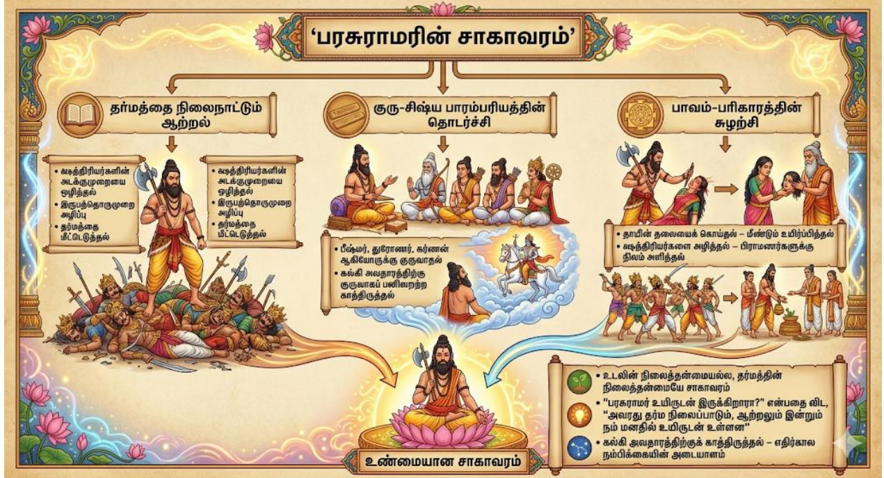
படம் 6: பரசுராமரின் சாகாவரத்தின் தத்துவ அடித்தளங்கள்

இந்த வரைபடம் பரசுராமரின் சாகாவரத்தின் மூன்று தத்துவ அடித்தளங்களை விளக்குகிறது. முதலாவதாக, "தர்மத்தை நிலைநாட்டும் ஆற்றல்" - ஷடத்திரியர்களின் அடக்குமுறையை இருபத்தொருமுறை அழித்து, தர்மத்தை மீட்டெடுத்ததன் மூலம் இப்பண்பு வெளிப்படுகிறது. இரண்டாவதாக, "குரு-சிஷ்ய பாரம்பரியத்தின் தொடர்ச்சி" - பீஷ்மர், துரோணர், கர்ணன் ஆகியோருக்குக் குருவாக இருந்ததும், எதிர்காலத்தில் கல்கி அவதாரத்திற்குக் குருவாகப் பணியாற்றக் காத்திருப்பதும் இதை வெளிப்படுத்துகின்றன. மூன்றாவதாக, "பாவம்-பரிகாரத்தின் சுழற்சி" - தாயின் தலையைக் கொய்து, பின்னர் உயிர்ப்பித்ததும், ஷடத்திரியர்களை அழித்து, பின்னர் பிராமணர்களுக்கு நிலம் அளித்ததும் இதை எடுத்துக்காட்டுகின்றன. இம்மூன்று அடித்தளங்களும் இணைந்து, உடலின் நிலைத்தன்மையல்ல, தர்மத்தின் நிலைத்தன்மையே உண்மையான சாகாவரம் என்னும் தத்துவத்தை நிறுவுகின்றன. "பரசுராமர் உயிருடன் இருக்கிறாரா" என்பதை விட, "அவரது தர்ம நிலைப்பாடும், ஆற்றலும் இன்றும் நம் மனதில் உயிருடன் உள்ளன" என்பதே உண்மையான சாகாவரமாகும். கல்கி அவதாரத்திற்காகக் காத்திருத்தல், எதிர்கால நம்பிக்கையின் அடையாளமாகவும் விளங்குகிறது.