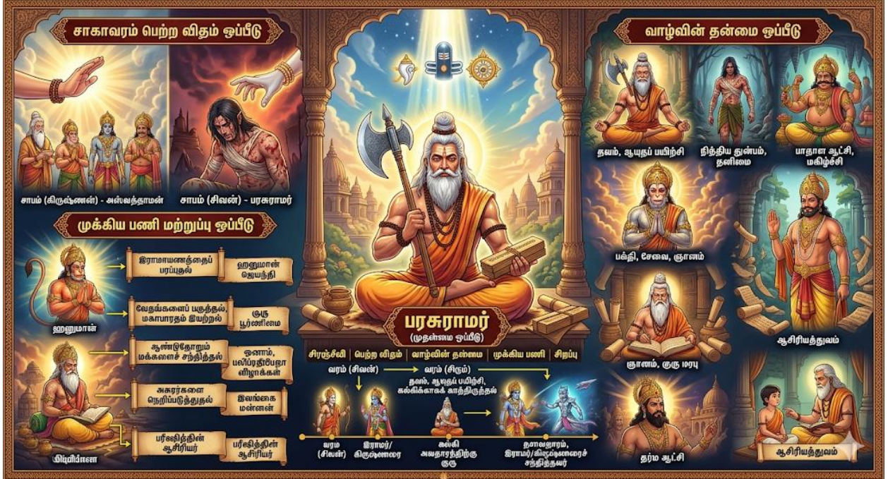
படம் 4: பரசுராமரின் சாகாவரம் – மற்ற சிரஞ்சீவிகளுடன் ஒப்பீடு

கல்கி புராணத்தின் படி, கல்கி யுகத்தின் முடிவில், விஷ்ணுவின் பத்தாவது அவதாரமான கல்கி தோன்றும்போது, பரசுராமர் அவருக்குப் போர் வித்தைகளையும், ஆன்மீக ஞானத்தையும் கற்றுத் தருவார் .