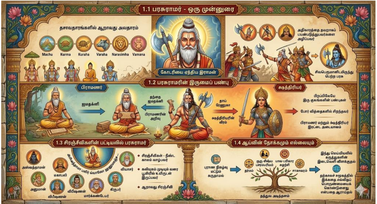
படம் 1: பரசுராமர் – அறிமுகக் கட்டமைப்பு

இந்த ஆய்வின் நோக்கம், பரசுராமரின் சாகாவரத்தை வெறும் புராண நிகழ்வாக மட்டும் கருதாமல், அதன் தத்துவ அடித்தளங்களை ஆழ்ந்து நோக்குவதாகும். இதன் மூலம், இந்து மெய்யியலில் தர்மம், குரு-சிஷ்ய பாரம்பரியம், பாவ-பரிகார சமுற்சி, சாகாவரம் ஆகிய கருத்துகளின் இடைவெளிகளை விளக்கவும், தற்காலச் சமூகத்தில் இக்கதை எவ்விதப் பொருண்மையைக் கொண்டுள்ளது என்பதை ஆராயவும் இக்கட்டுரை முயல்கிறது.