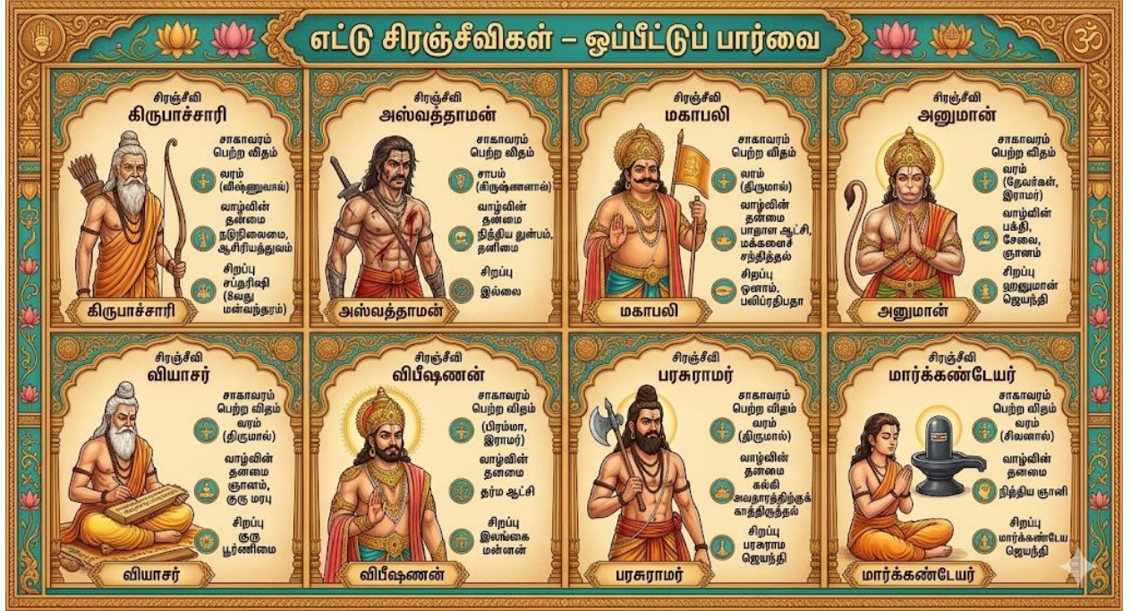
படம் 4: எட்டு சிரஞ்சீவிகள் - ஒப்பீட்டுப் பார்வை

இந்த அட்டவணை எட்டு சிரஞ்சீவிகளையும் ஒப்பிட்டுக் காட்டுகிறது. கிருபாச்சாரி மட்டுமே நடுநிலைமை, ஆசிரியத்துவத்திற்கான வெகுமதியாகச் சாகாவரம் பெற்று, எட்டாவது மன்வந்தரத்தில் சப்தரிஷியாகும் பதவியையும் பெற்றவர். அஸ்வத்தாமன் சாபத்தால் நித்திய துன்பமுற்ற நிலையில், இவர் வரத்தால் நிலைத்தார்.