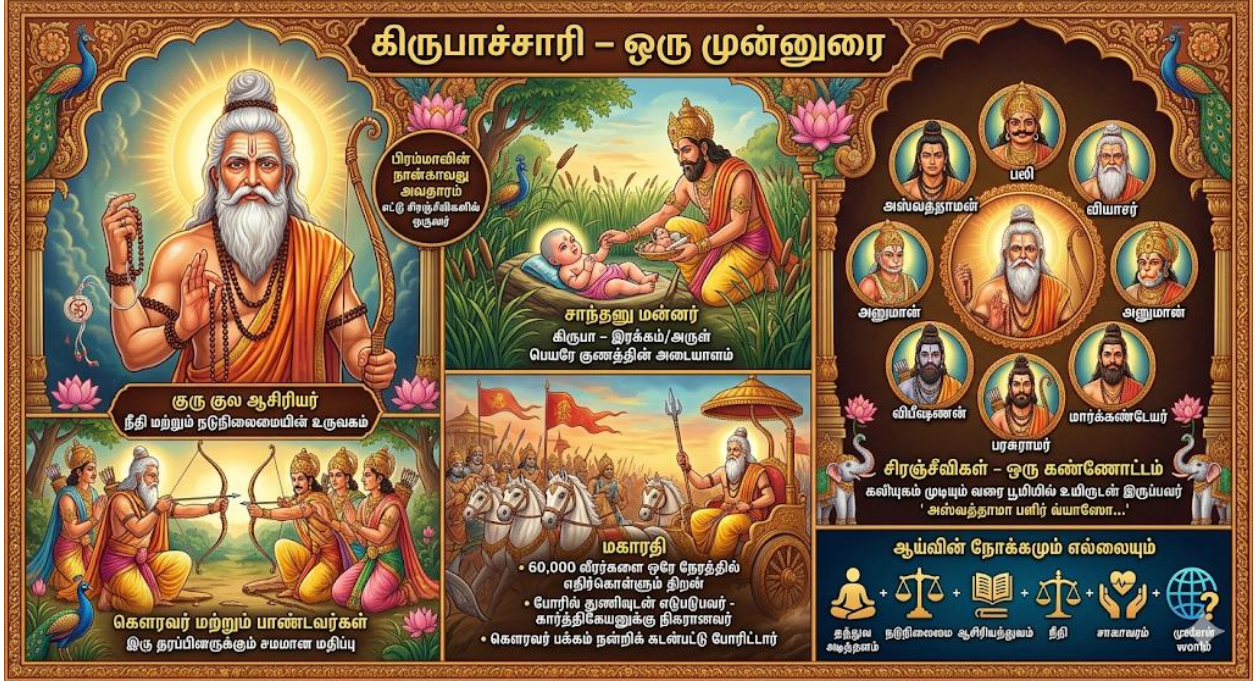
படம் 3: கிருபாச்சாரி - ஒரு முன்னுரை

மெய்யியலில் நடுநிலைமை, ஆசிரியத்துவம், நீதி, சாகாவரம் ஆகிய கருத்துகளின் இடைவெளிகளை விளக்கவும், தற்காலச் சமூகத்தில் இக்கதை எவ்விதப் பொருண்மையைக் கொண்டுள்ளது என்பதை ஆராயவும் இக்கட்டுரை முயல்கிறது.