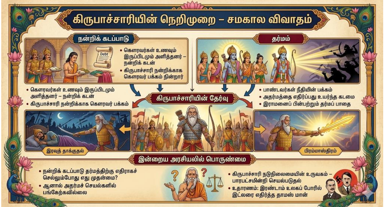
படம் 7: கிருபாச்சாரியின் நெறிமுறை – நன்றிக் கடப்பாடு VS தர்மம்

"கிருபாச்சாரி நடுநிலைமை என்ற நற்பண்பின் உருவகமாக விளங்கினார். கௌரவர்கள் அதர்மத்தின் பக்கம் இருப்பதை அறிந்திருந்தும், அவர்கள் தமக்குச் செய்த உதவிக்குக் கடமைப்பட்டு அவர்களுக்கு ஆதரவாகப் போரிட்டார். ஆனால், அதர்மச் செயல்களில் பங்கேற்கவில்லை".