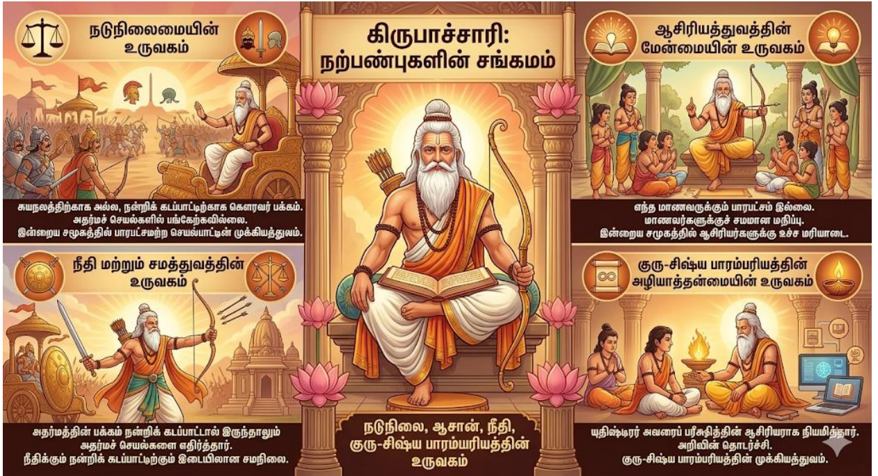
படம் 6: கிருபாச்சாரி – தற்காலச் சமூகத்தில் நான்கு உருவகங்கள்

கிருபாச்சாரி குரு-சிஷ்ய பாரம்பரியத்தின் அழியாதன்மையின் உருவகமாகவும் விளங்குகிறார். போரின் முடிவில், யுதிஷ்டிரர் அவரைப் பரிசுஷித்தின் ஆசிரியராக நியமித்தார். இன்றைய சமூகத்தில், அறிவின் தொடர்ச்சி, குரு-சிஷ்ய பாரம்பரியத்தின் முக்கியத்துவத்தை இக்கதை வலியுறுத்துகிறது.