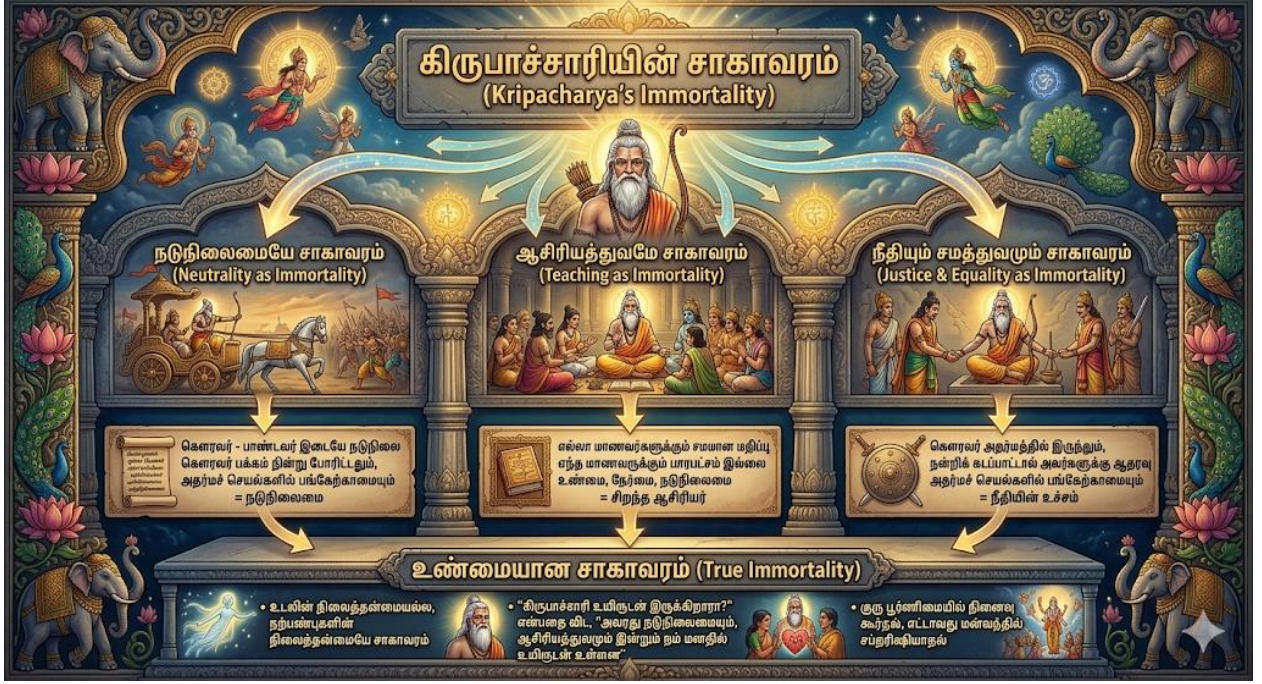
படம் 5: கிருபாச்சாரியின் சாகாவரத்தின் தத்துவ அடித்தளங்கள்

மேலுள்ள வரைபடம் கிருபாச்சாரியின் சாகாவரத்தின் மூன்று தத்துவ அடித்தளங்களை விளக்குகிறது. முதலாவதாக, "நடுநிலைமையே சாகாவரம்" – கௌரவர்-பாண்டவர் இடையே நடுநிலை காப்பதும், கௌரவர் பக்கம் நின்று போரிட்டதும், அதர்மச் செயல்களில் பங்கேற்காமையும் நடுநிலைமையின் சிறப்பைக் காட்டுகிறது. இரண்டாவதாக, "ஆசிரியத்துவமே சாகாவரம்" – எல்லா மாணவர்களுக்கும் சமமான மதிப்பு அளித்ததும், எந்த மாணவருக்கும் பாரபட்சம் காட்டாமையும், உண்மை, நேர்மை, நடுநிலைமை ஆகிய நற்பண்புகளும் அவரைச் சிறந்த ஆசிரியராக மாற்றின. மூன்றாவதாக, "நீதியும் சமத்துவமும் சாகாவரம்" – கௌரவர்கள் அதர்மத்தில் இருந்தும், நன்றிக் கடப்பாட்டால் அவர்களுக்கு ஆதரவு அளித்ததும், அதர்மச் செயல்களில் பங்கேற்காமையும் நீதியின் உச்சநிலையாகும். இம்மூன்று அடித்தளங்களும் இணைந்து, உடலின் நிலைத்தன்மையல்ல, நற்பண்புகளின் நிலைத்தன்மையே உண்மையான சாகாவரம் என்னும் தத்துவத்தை நிறுவுகின்றன. "கிருபாச்சாரி உயிருடன் இருக்கிறாரா" என்பதை விட, "அவரது நடுநிலைமையும், ஆசிரியத்துவமும் இன்றும் நம் மனதில் உயிருடன் உள்ளன" என்பதே உண்மையான சாகாவரமாகும்.